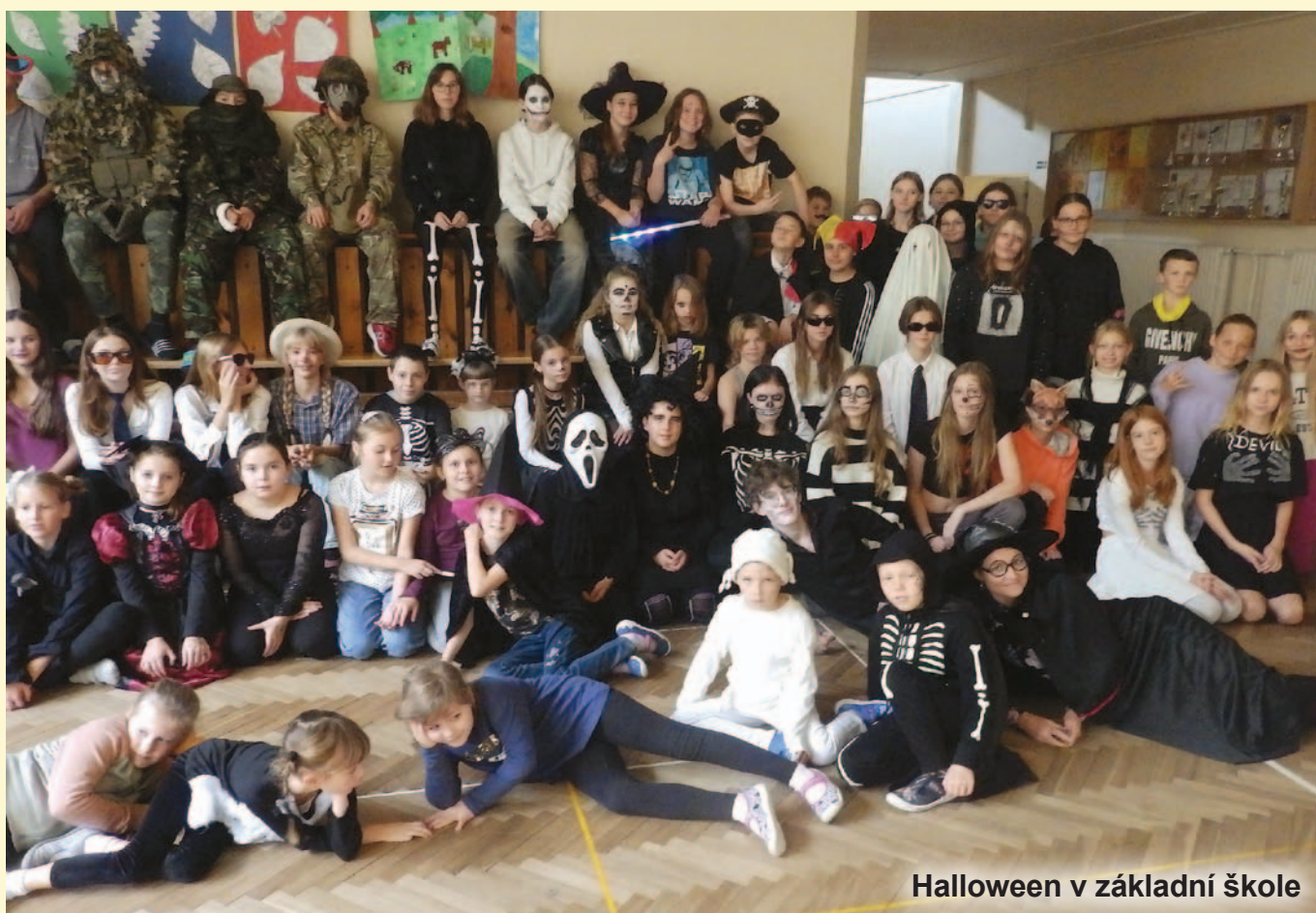
Halloween v základní škole