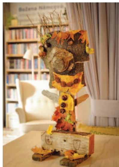
Vendula Nunvářová – Přírodníček