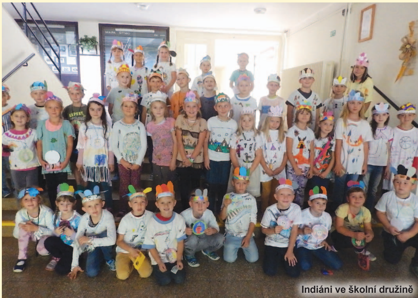
Indiáni ve školní družině