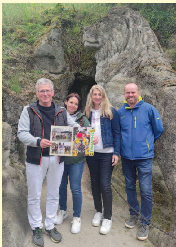
Zdravíme čtenáře z výjezdního zasedání DSO Cezava od Jeskyně Blanických rytířů v Rudce