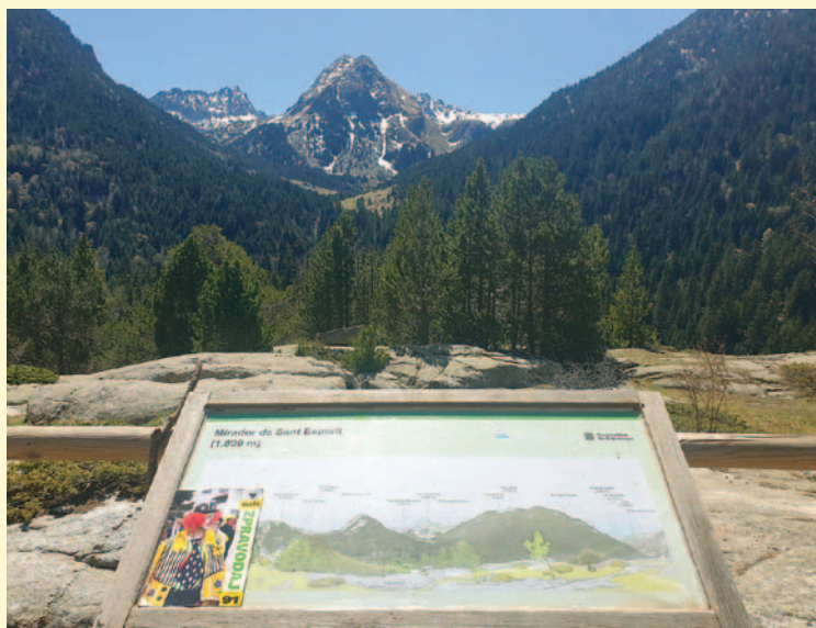
Otnický zpravodaj v Pyrenejích