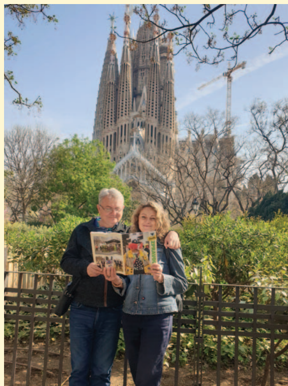
Bublovi posílají pozdrav z Barcelony