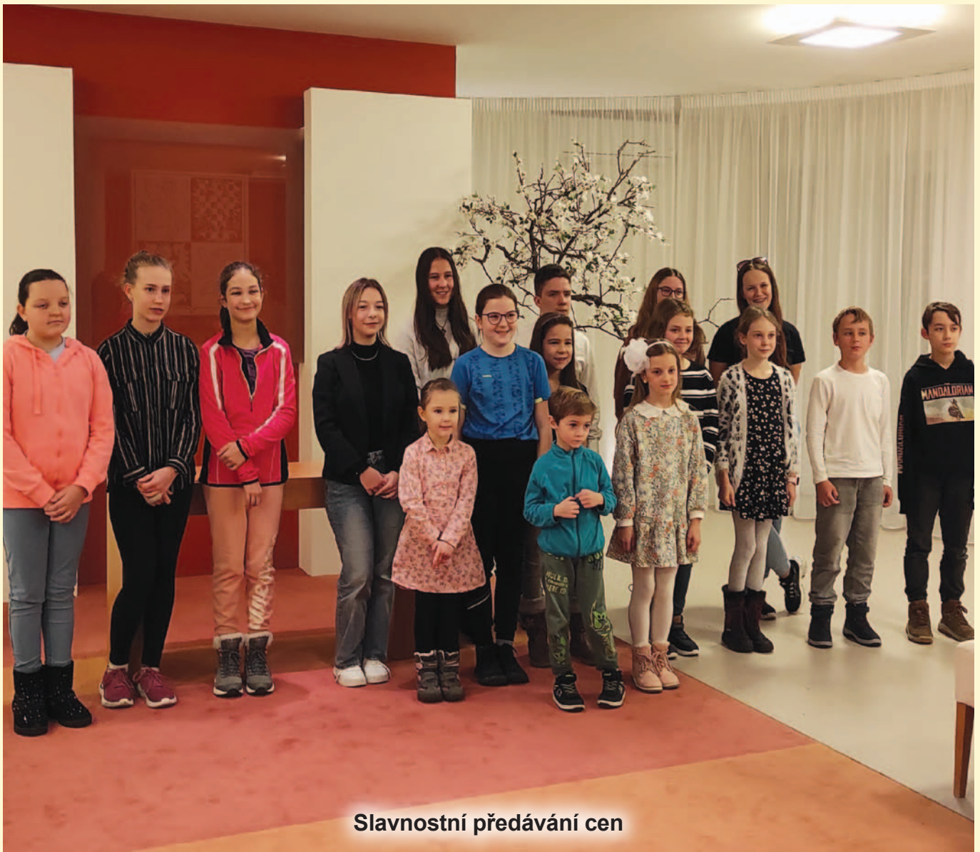
Slavnostní předávání cen