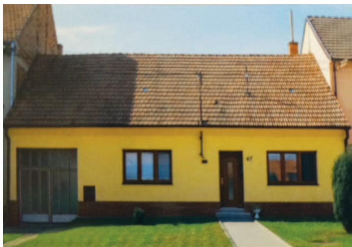
Fotografie domu po II. světové válce a ze současnosti jsme získali z knih o naší obci: Otnice ve fotografiích a Otnice v proměnách času