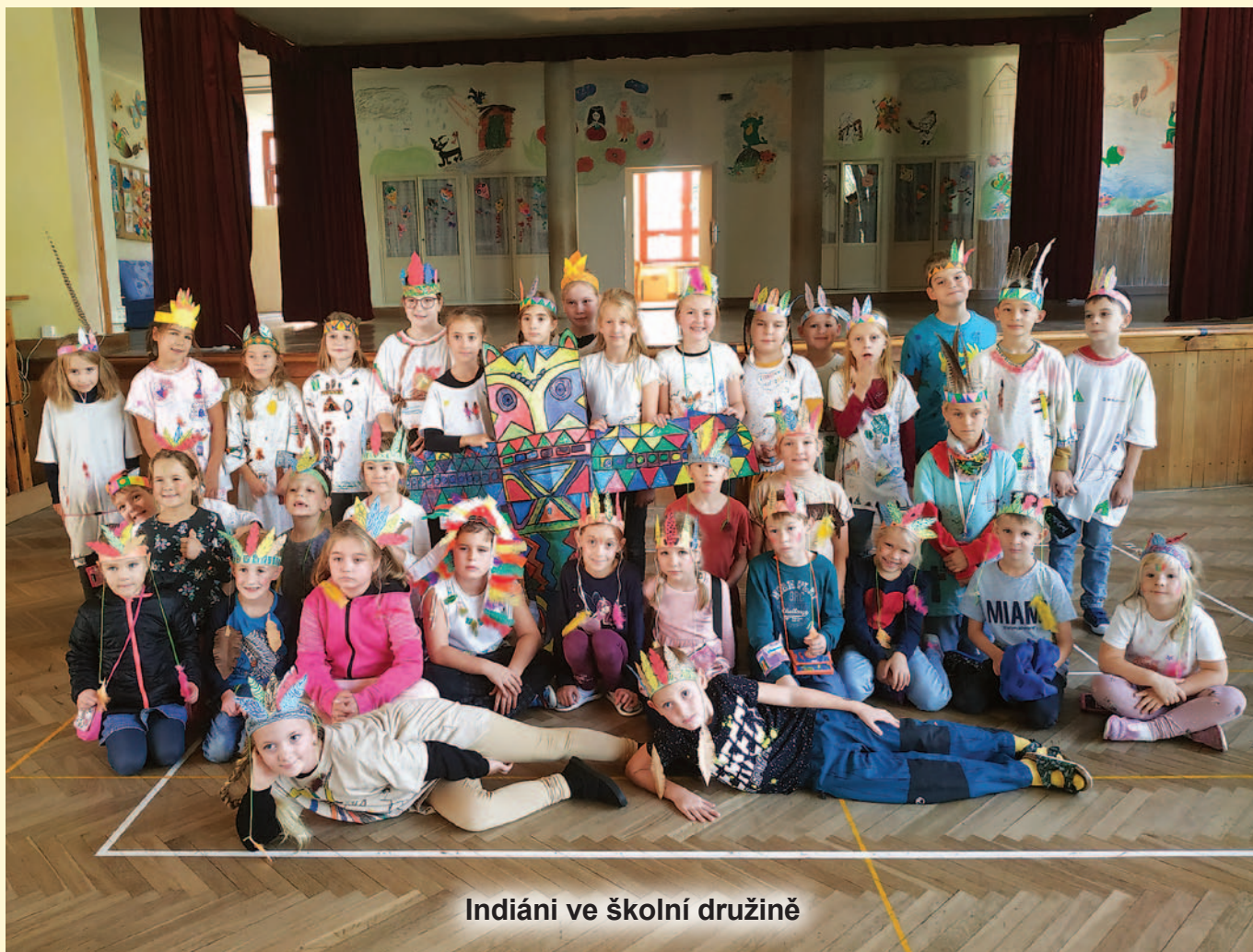
Indiáni ve školní družině