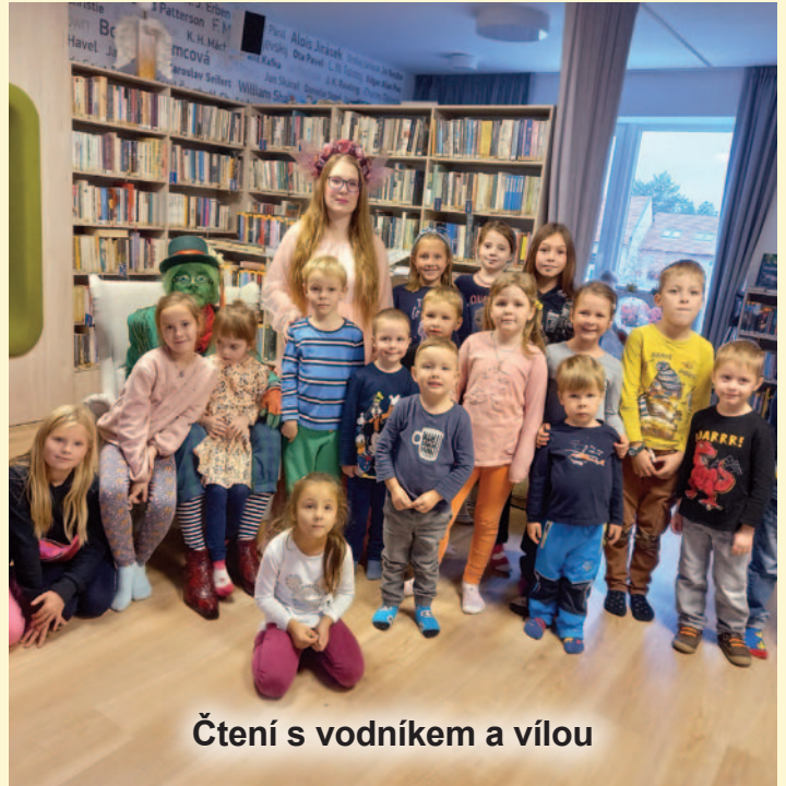
Čtení s vodníkem a vílou