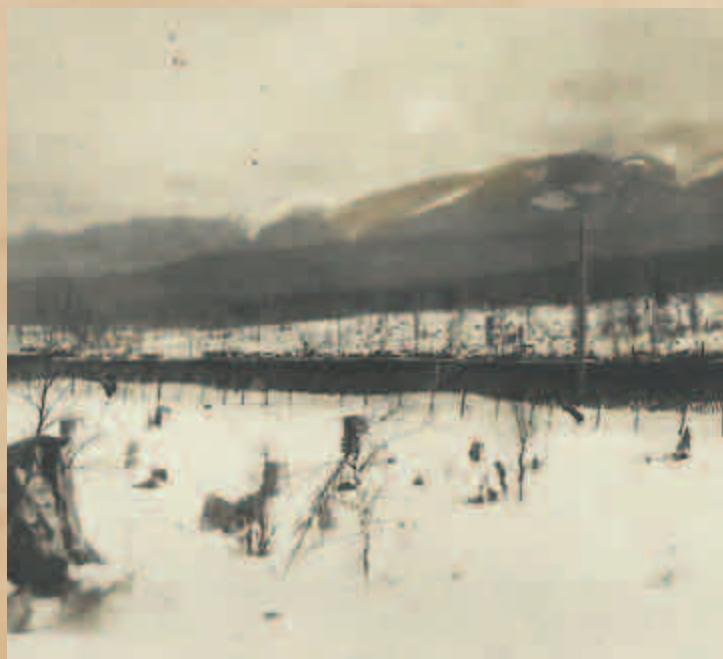
Náš vlak ve st. Polovina

1.10. ceremoniální marš na Glázgově až do do 3. 10. 5. 10. v 11 hod. v noci na službu. 6. 10. do ešalonů, ve 2 hod. odpoledne změna. Ve 12 hod. v noci opouštíme Irkutsk. Ráno 7. 10. na st. Bělaja padá sněh. V 11 hod. dopoledne st. Polovina. Čeremuchovo oběd. Na večer st. Zima. 8. 10. ráno st. Nižní Udinsk. V 11 hod. odjezd. Na rozjezdě oběd. Na st. Uk. V noci 9. 10. st. Kansk Jenisejský. Večer jsme přijeli do Krásnodarska. 10. 10. v 10 hod. dopoledne Novonikolajevsk. Večer st. Čulinskája, st. Kargot. 12. 10. ve 3 hod. ráno příjezd na st. Barabinsk. V poledne st. Teliskája, večer st. Tatarskája. Příjezd v 10 hod. do Omska. Časné ráno jsme jeli dále směrem k Jekatěrinburku. 13. 10. st. Kulomzino, pak st. Ljubinskája, st. Dragunskája. Ve 12 hod. Nazivajevskája oběd; odpoledne st. Maslojanskája, na večer Jišim. 14. 10. ráno na st. Tjumeň, st. Podjem, st. Poklevskája, zde