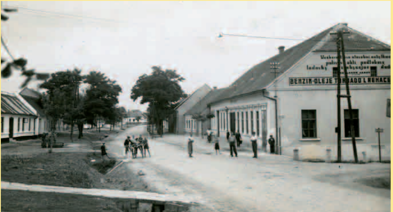
Před sto lety...