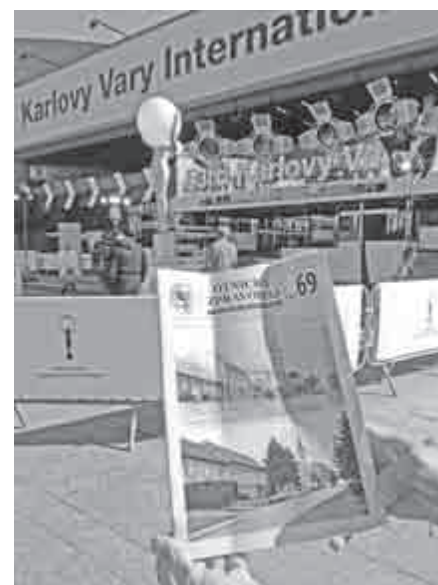
Otnický zpravodaj byl na 53. Mezinárodním filmovém festivalu v Karlových Varech.