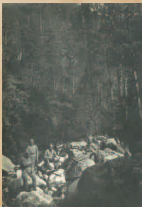
V bajkalských horách