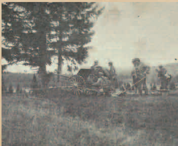
Rychlopalné dělo v činnosti