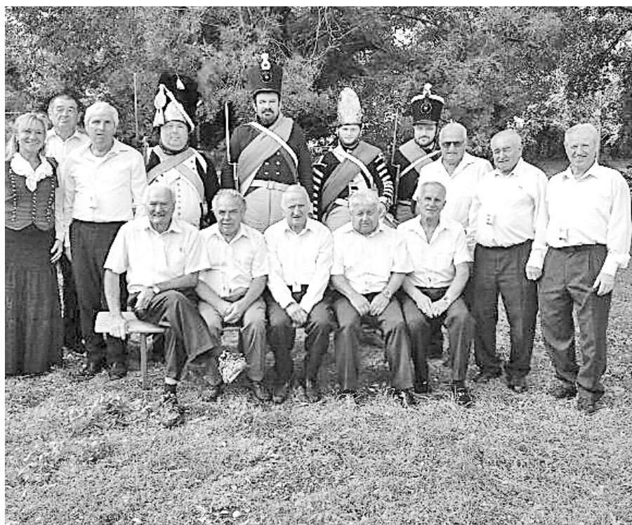
Naši Bloňďáci se 15. září zúčastnili v areálu Domova pro seniory v Sokolnicích mezigeneračního dne „Byla vojna byla“.

Registrováno Ministerstvem kultury ČR pod registračním číslem MK ČR E 13052 Vydává obec Otnice čtvrtletně.