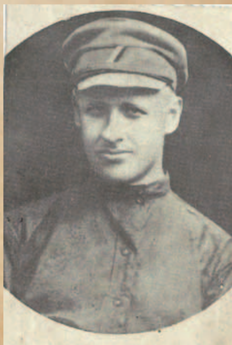
Podplukovník Ušakov umučený bolševiky