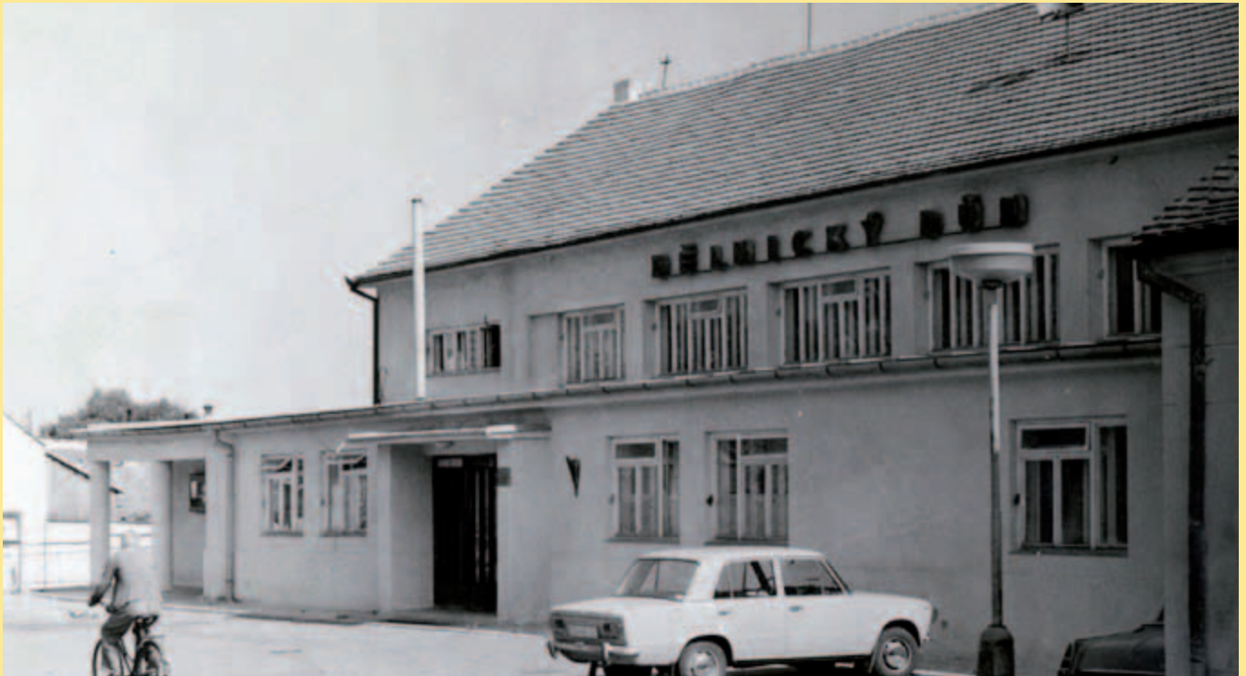
Před padesáti lety...