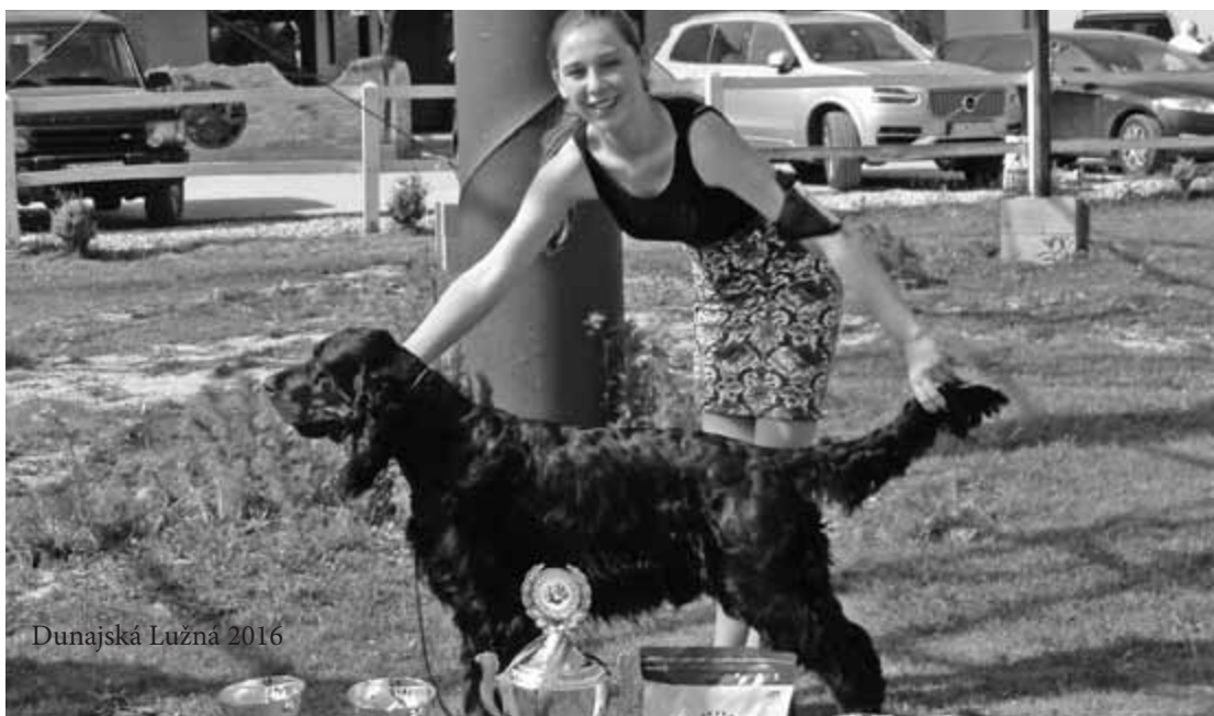
Dunajská Lužná 2016

Gratulujeme a přejeme hodně dalších chovatelských úspěchů.