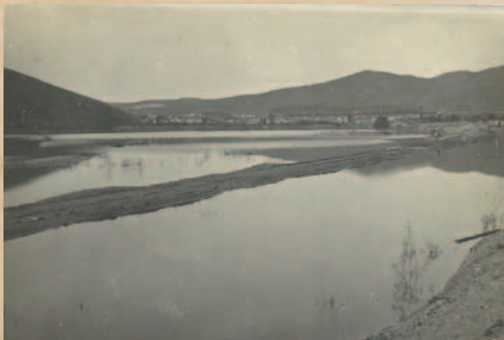
Železniční most poškozený bolševiky

1. 7. příjezd na post č. 1464, po obědě do st. Kimiltěj. Po příjezdu jsme se šli dívat za stanici na dva železné mosty, které byly přes řeku Kimiltěj poškozeny od bolševiků. Ve 3 hod. nástup a šli jsme na st. Zimu, 25 vert vzdálené, a sice 1. a 2. rota a kulometná rota. Když jsme však přišli za most, stál na trati prázdný ešalon, připravený již pro nás obyvatelstvem města Zimy. Ti úskočným způsobem bolševiky zahnali a zabránili zničení velkého železničního mostu i vodokačky u nádraží. Do stanice jsme jeli velkou rychlostí. Na stanici se lidé sbíhali ze všech stran a vítali nás jako osvoboditele s velkou radostí. 12. 7. z vesničky Uril jsme jeli všichni na povozkách po Moskevském traktu až do Irkutska, který již dobyli kozáci s naší jízdou i úderným batalijonem. Do města jsme přišli v 10 hod. dopoledne, právě na ruský svátek. Ubytování jsme byli