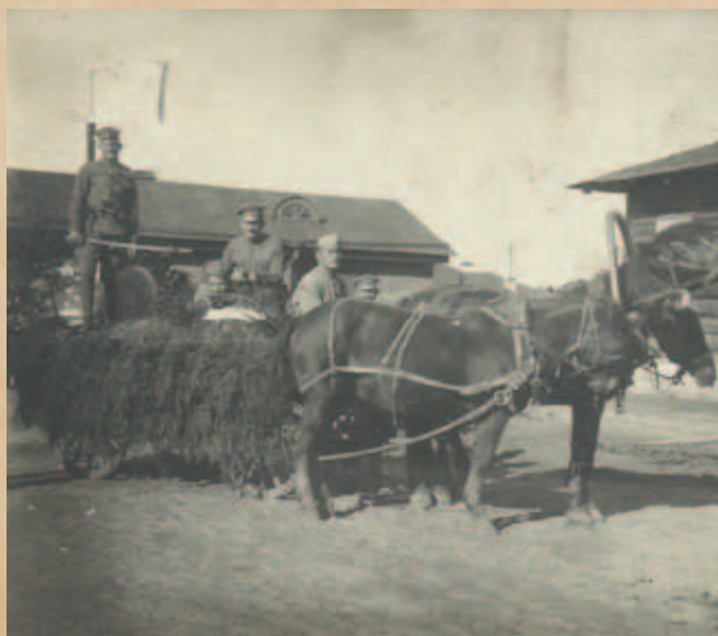
Svatováclavská slavnost v Irkutsku

7. 8. ráno za svitu nastupují pluky Irkutské Zabajkalské a Jenisejské, které zde jdou poprvé do boje. My jsme jako rezerva. 11. 8. neděle odpoledne do tajgy k řece Sněžnej, kde jsou rozběhaní bolševici. 13. 8. ráno dále na st. Kedrovája. 18. 8. ráno jsme dostali příkaz ihned přijet do st. Mysová. Když jsme přijeli k samé stanici, tu vidíme shořený parochod Bajkal, který stál nedaleko přístavu. Zvěděli jsme, že parochod zapálili naše části,