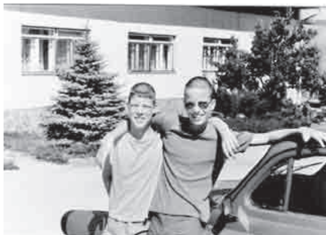
Rok 1998 Osamocený smřček rostl o to svižněji...