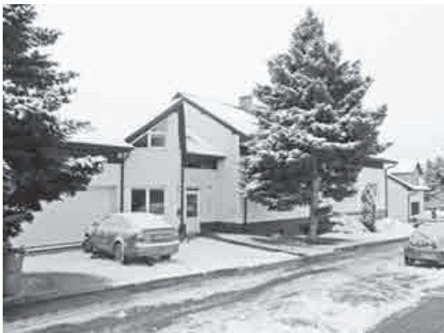
Rok 2015: Čiperný konifer přesáhl 10 m, svými kořeny zvedal chodník a větvemi škodil střeše.