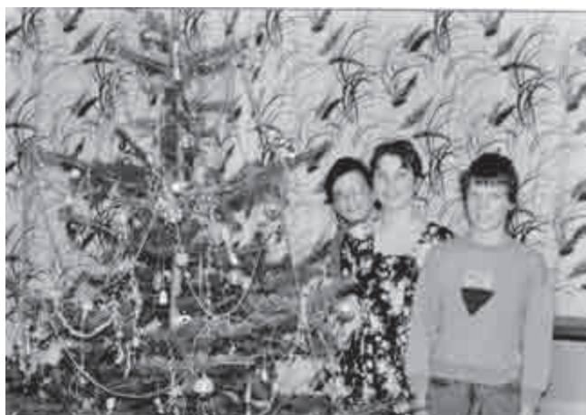
A tak jeden z nich se stal vánočním stromkem již v roce 1996.