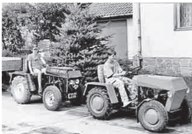
Jenže 2 m měly už po 7 letech a začaly si překážet. Na fotografii jsou stromky skutečně dva.