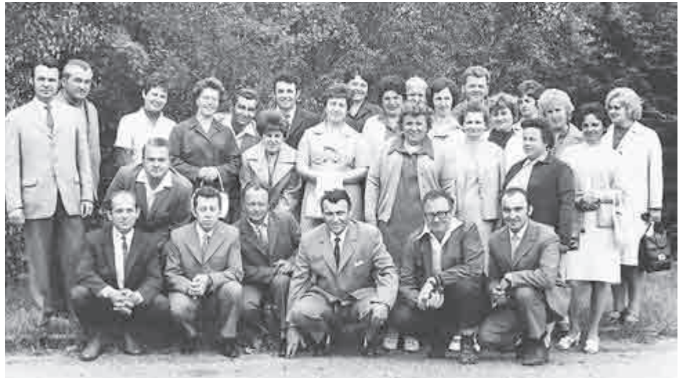
Setkání ve čtyřiceti letech v roce 1973.