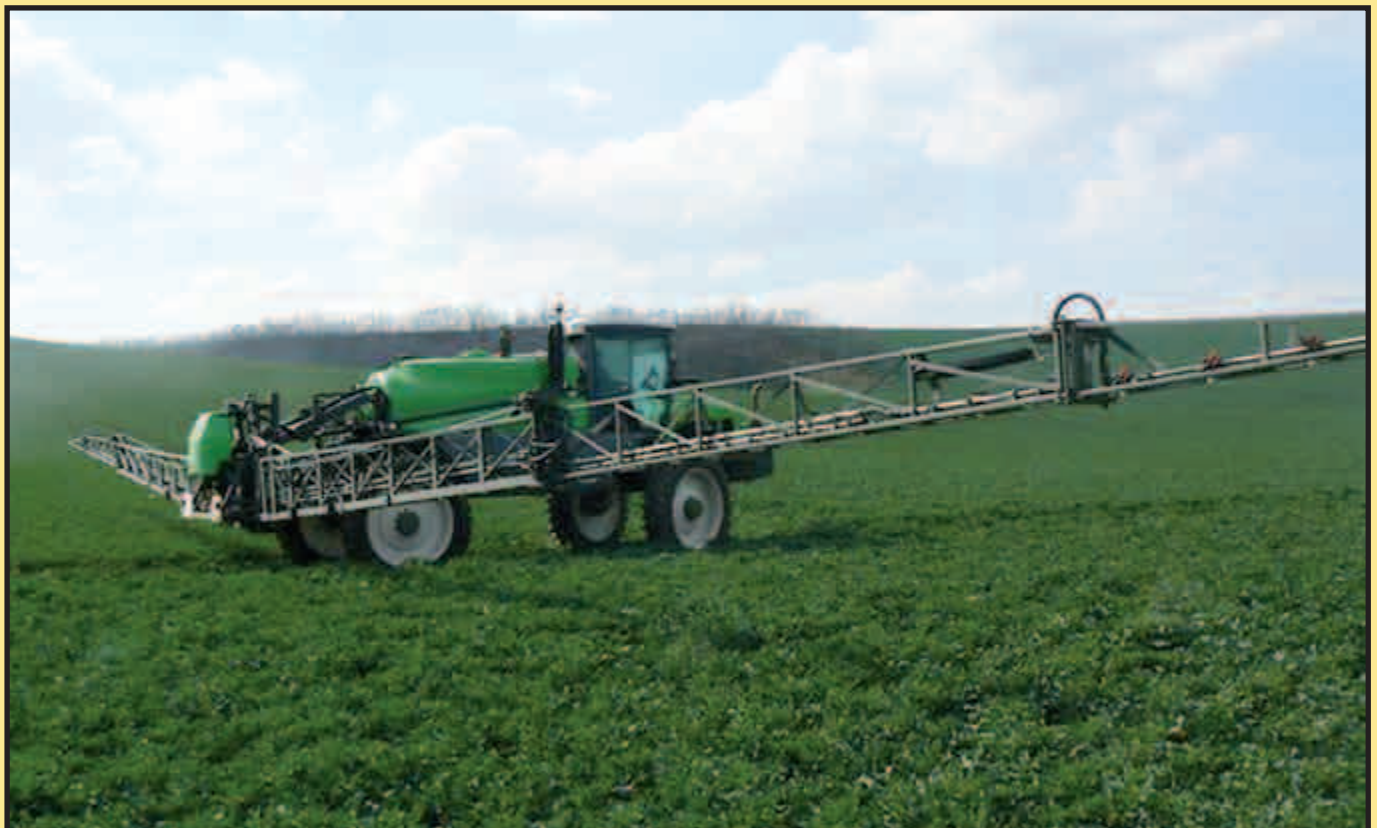
...současná zemědělská technika