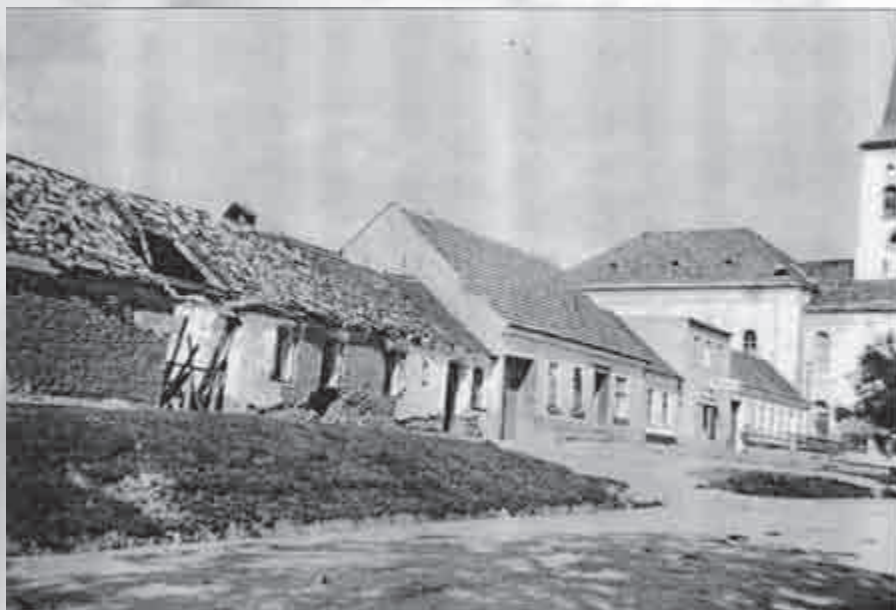
Poničený dům ze 2. sv. války, dnes budova Katolického domu, zásah patrný i na kostelní věži