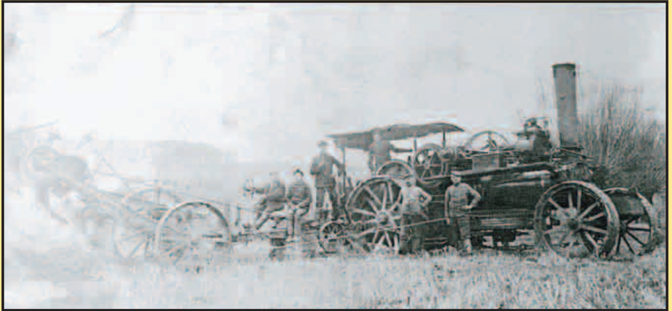
Počátky mechanizace v zemědělství...