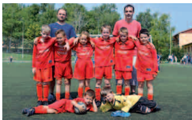
Fotbalová příprava s trenéry