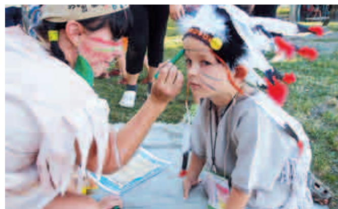
Vydařené Indiánské odpoledne 16. srpna