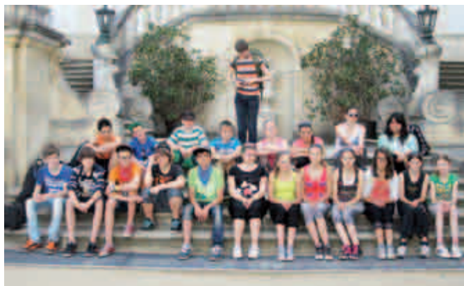
Červnový vlastivědný zájezd žáků 7. třídy: Vranov nad Dyjí – Znojmo