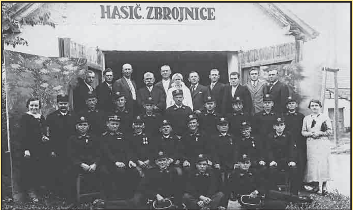
Dobrovolní hasiči z Ottnic v období mezi světovými válkami...