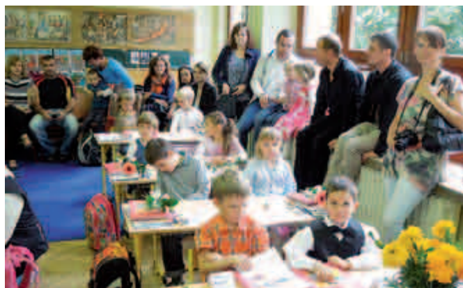
Poprvé v školních lavicích v doprovodu rodičů 2. září