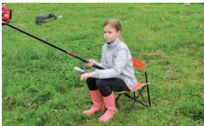
Rybářské závody pro děti 1. června