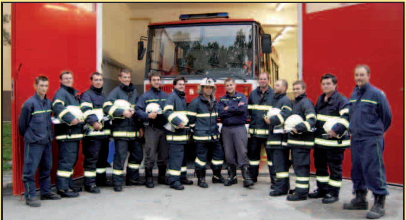
... a ottničtí hasiči v současnosti.