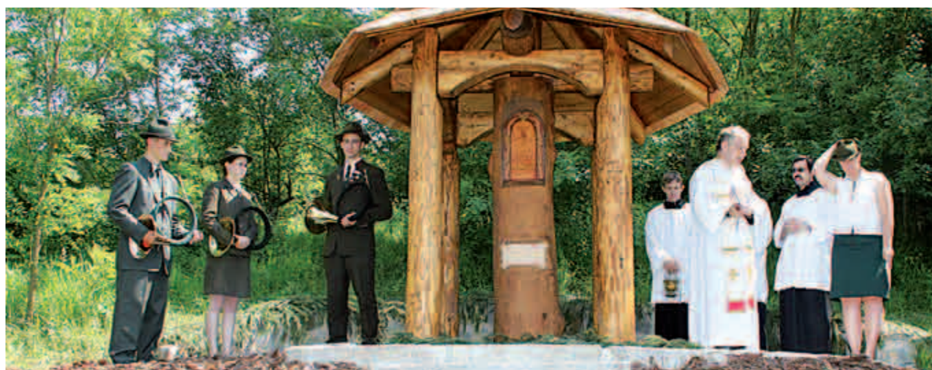
Svěcení dřevořezby sv. Huberta