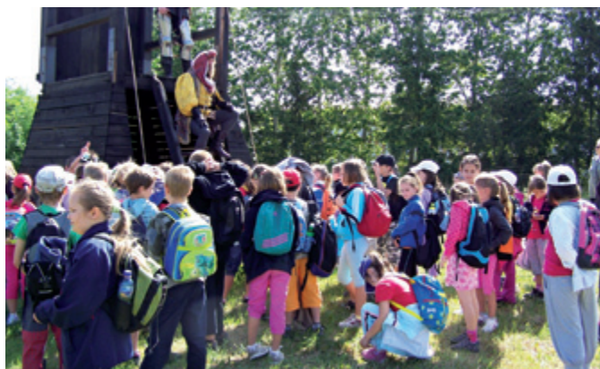
Na výletě v Habrovanech