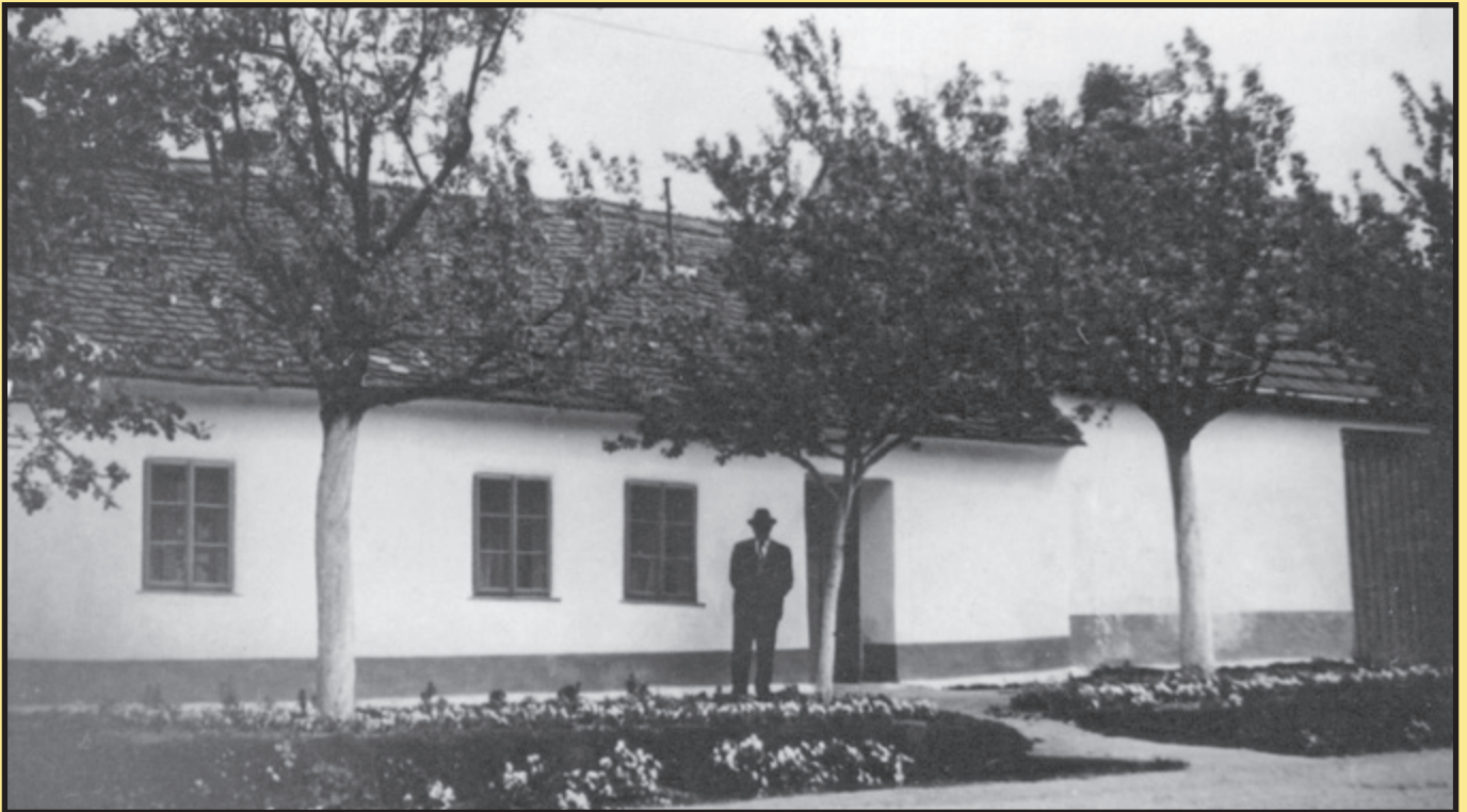
Dům č. p. 106 Ant. Sajtla...