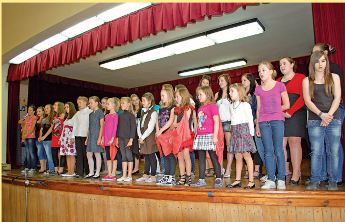
Besídka ke Dni matek v základní škole v r. 2012