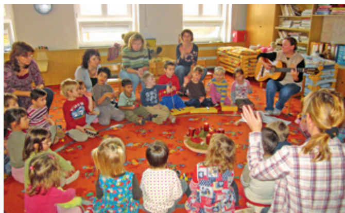
Děti v Dětském domově LILA