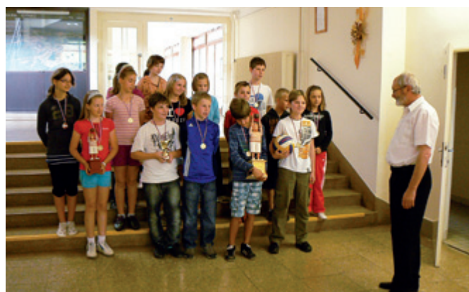
Den s komisí Vesnice roku