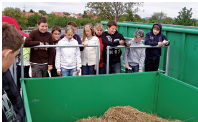
Návštěva sběrného dvora