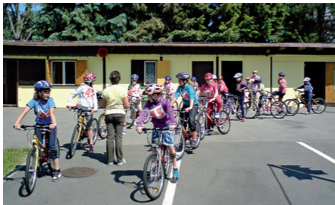
Dopravní hřiště ve Vyškově