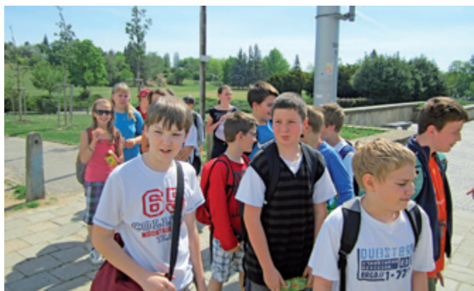
Návštěva Planetária v Brně