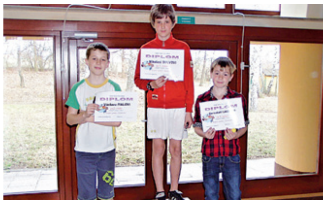
Vítězové Otnické laťky