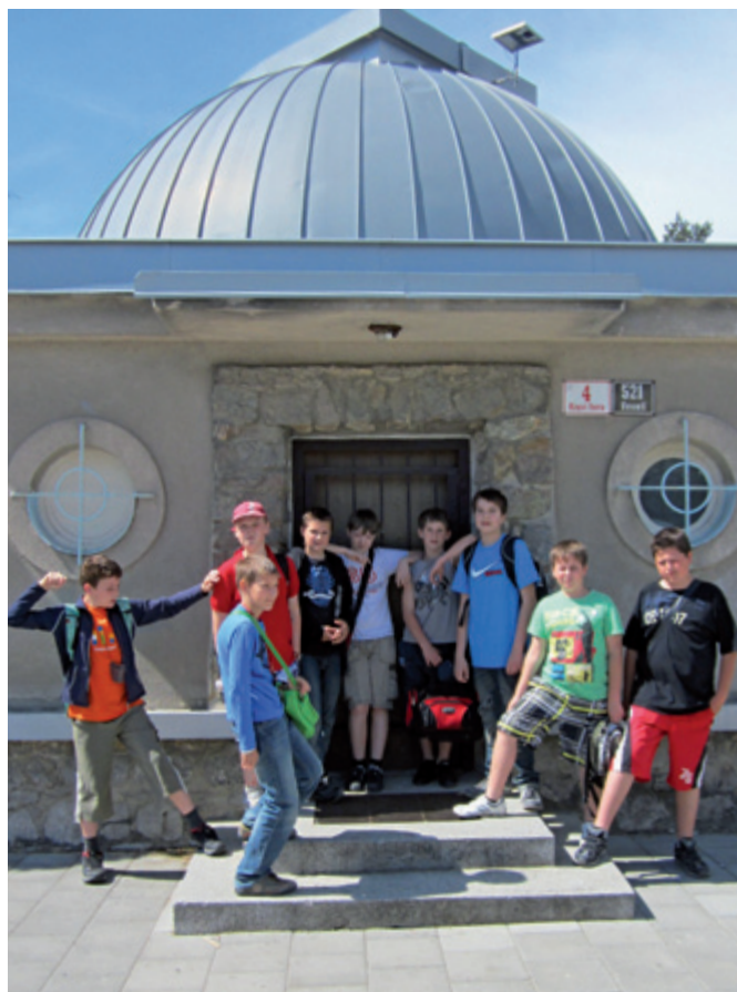
Návštěva Planetária v Brně