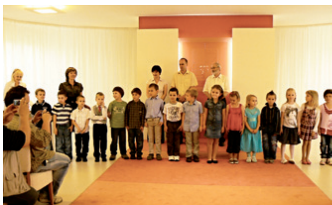
Rozloučení s předškoláky