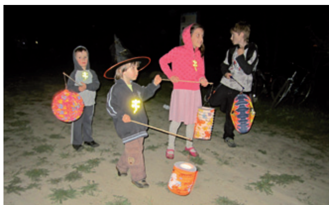
Vítání jara se světlůškami