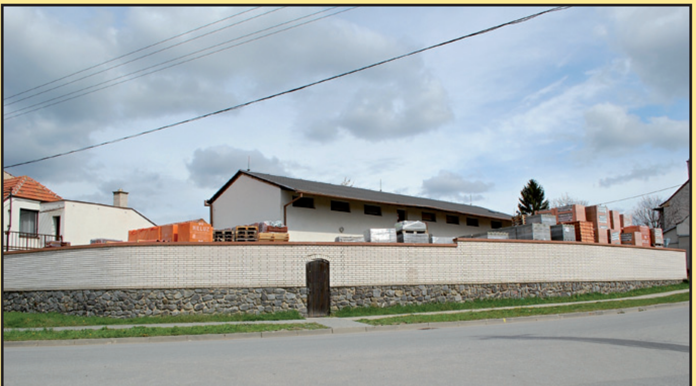
...dnes sklad stavebnin.