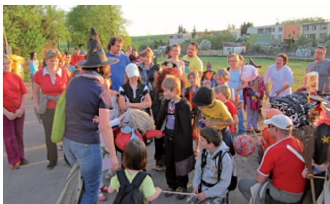
Vítání jara se světlůškami