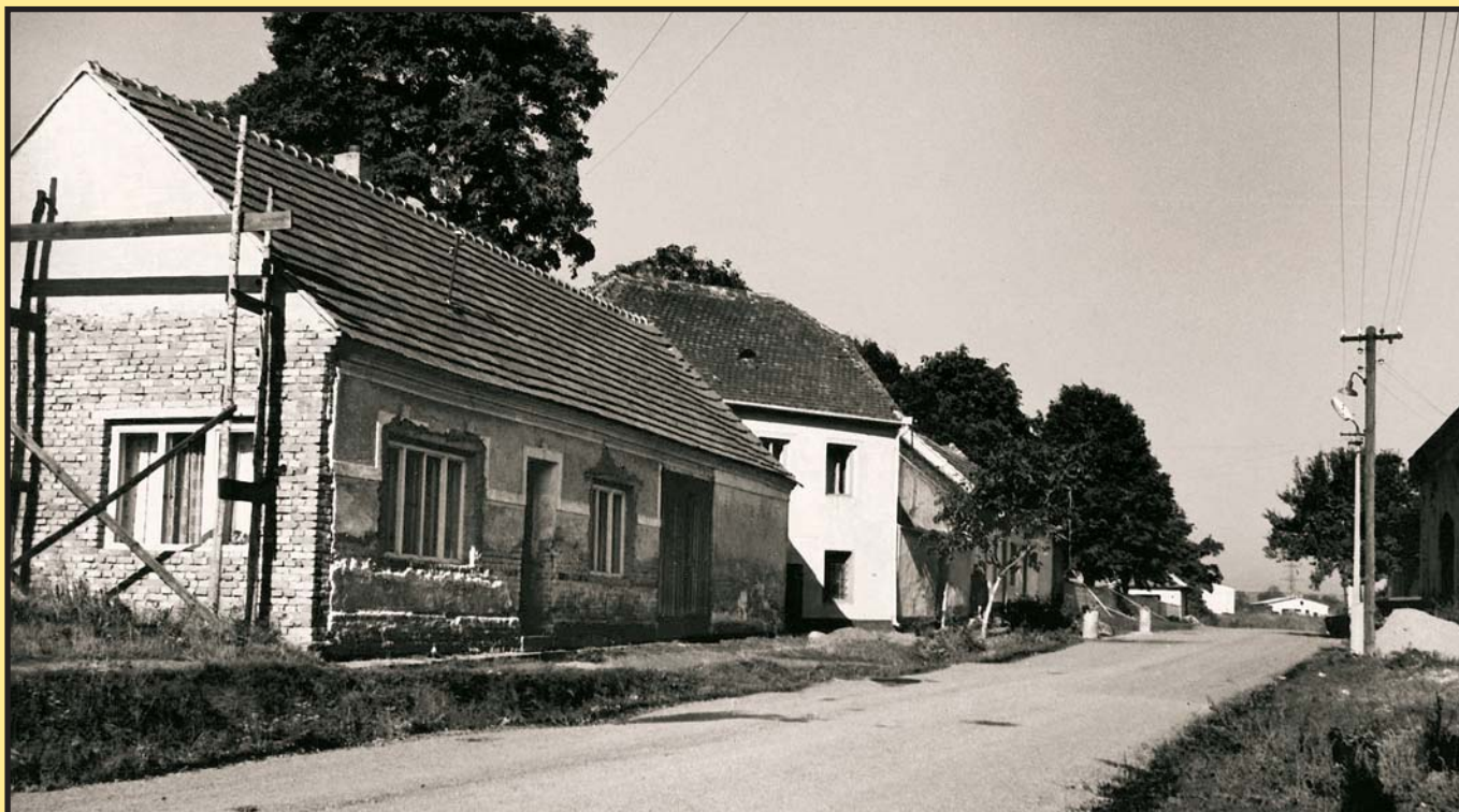
Ulice Boženy Němcové směrem ke hřbitovu před léty...