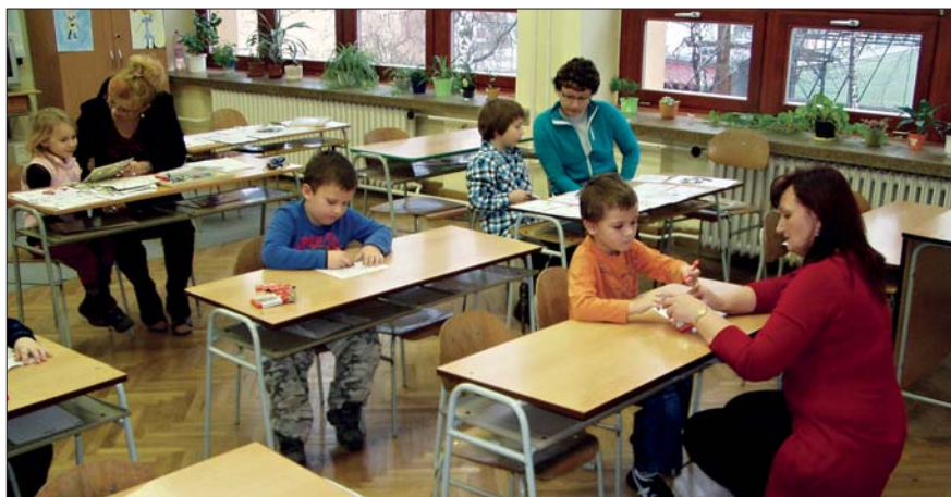
Zápis dětí do 1. třídy