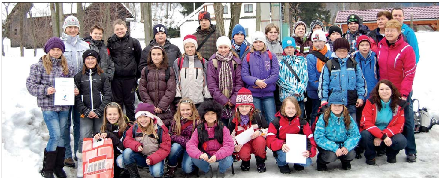
Zimní škola v přírodě