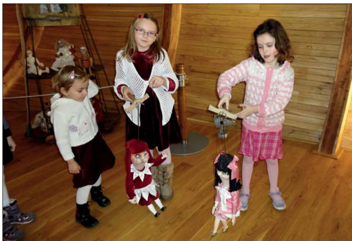
Návštěva loutkového divadla