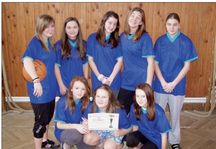
Žákyně 7. tříd a jejich úspěch: 3. místo v basketbalu