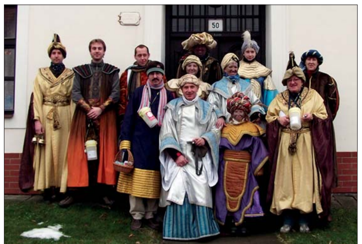
Dobrovolníci Tříkrálové sbírky.