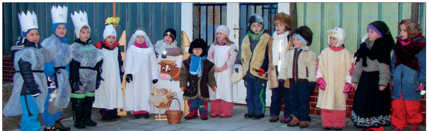
Tři králové v mateřské školce.