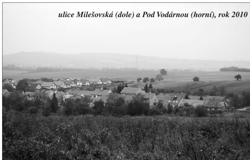
ulice Milešovská (dole) a Pod Vodárnou (horní), rok 2010