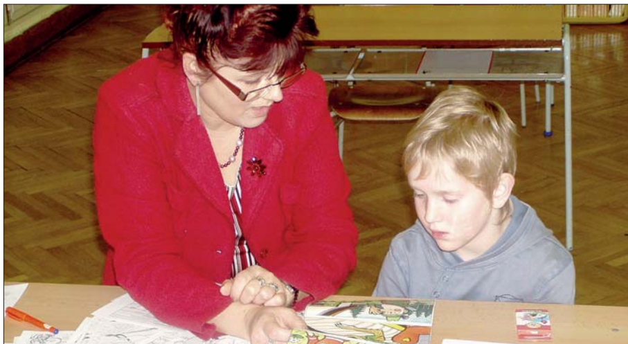
Zápis do 1. třídy ZŠ.