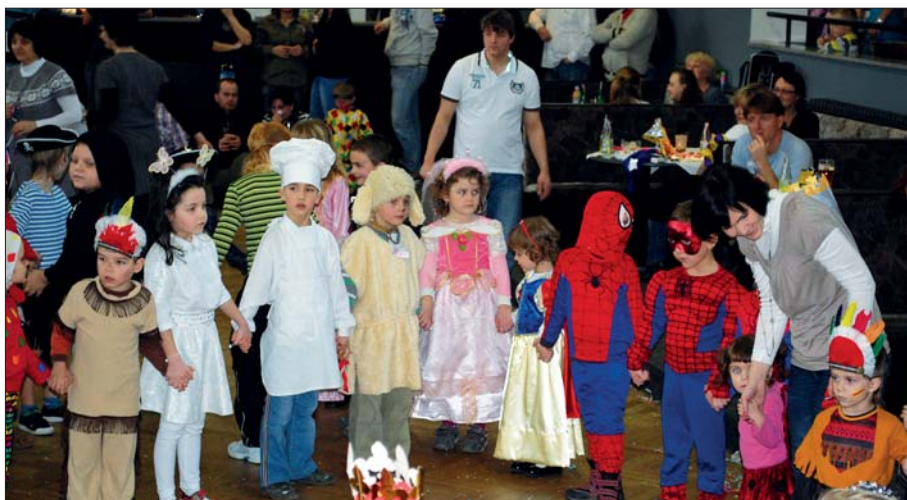
Maškarní ples pro děti v dělnickém domě.