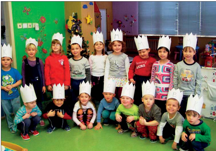
Děti z MŠ, oddělení Broučků.