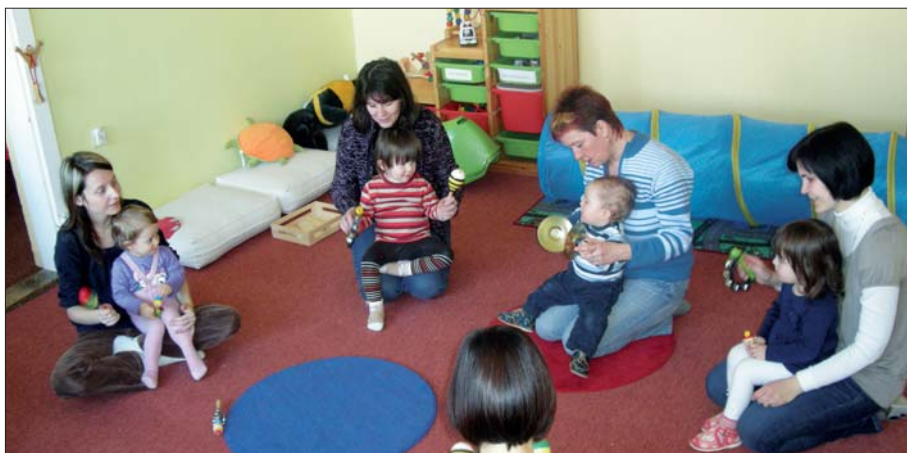
Mimiklub v Otnickém Sadu.