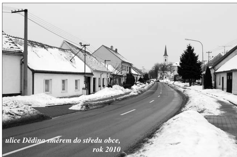
ulice Dědina směrem do středu obce, rok 2010

zemědělských usedlostí. Zde se mlátivalo obilí drobným hospodářům. Za kostelem, kde dnes stojí škola, pole zvaná Zákostelí . Od Markového k parku u sv. Jána zván Rajčurňa – vojsko zde cvičovalo koně a je to moc dávno, jak píše kronika.