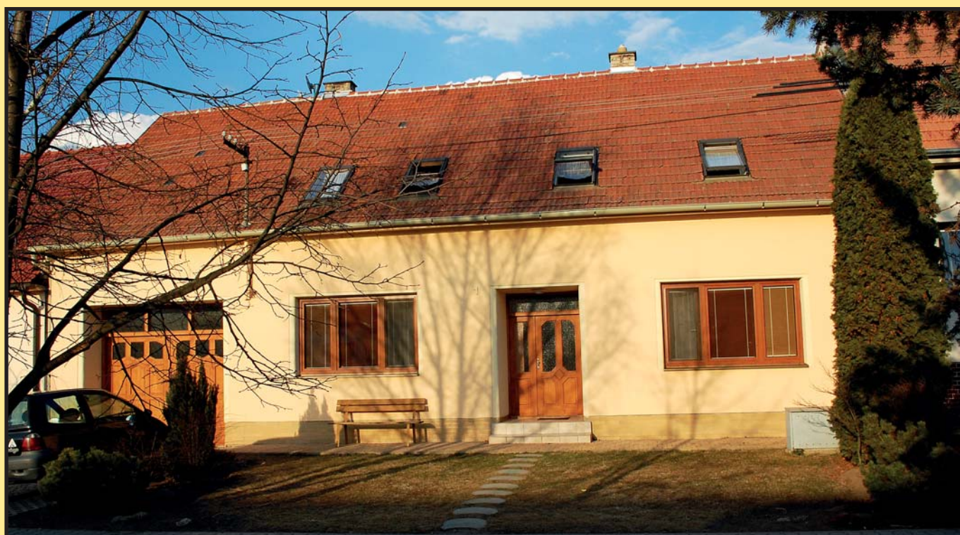
... a dnes.