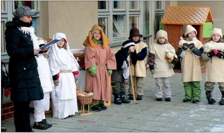
Vánoční besídka na zahradě MŠ.