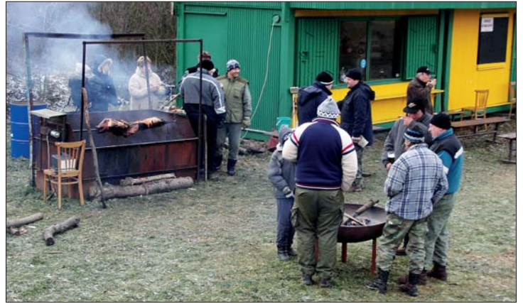
Štěpánské opékání selete u rybníka.