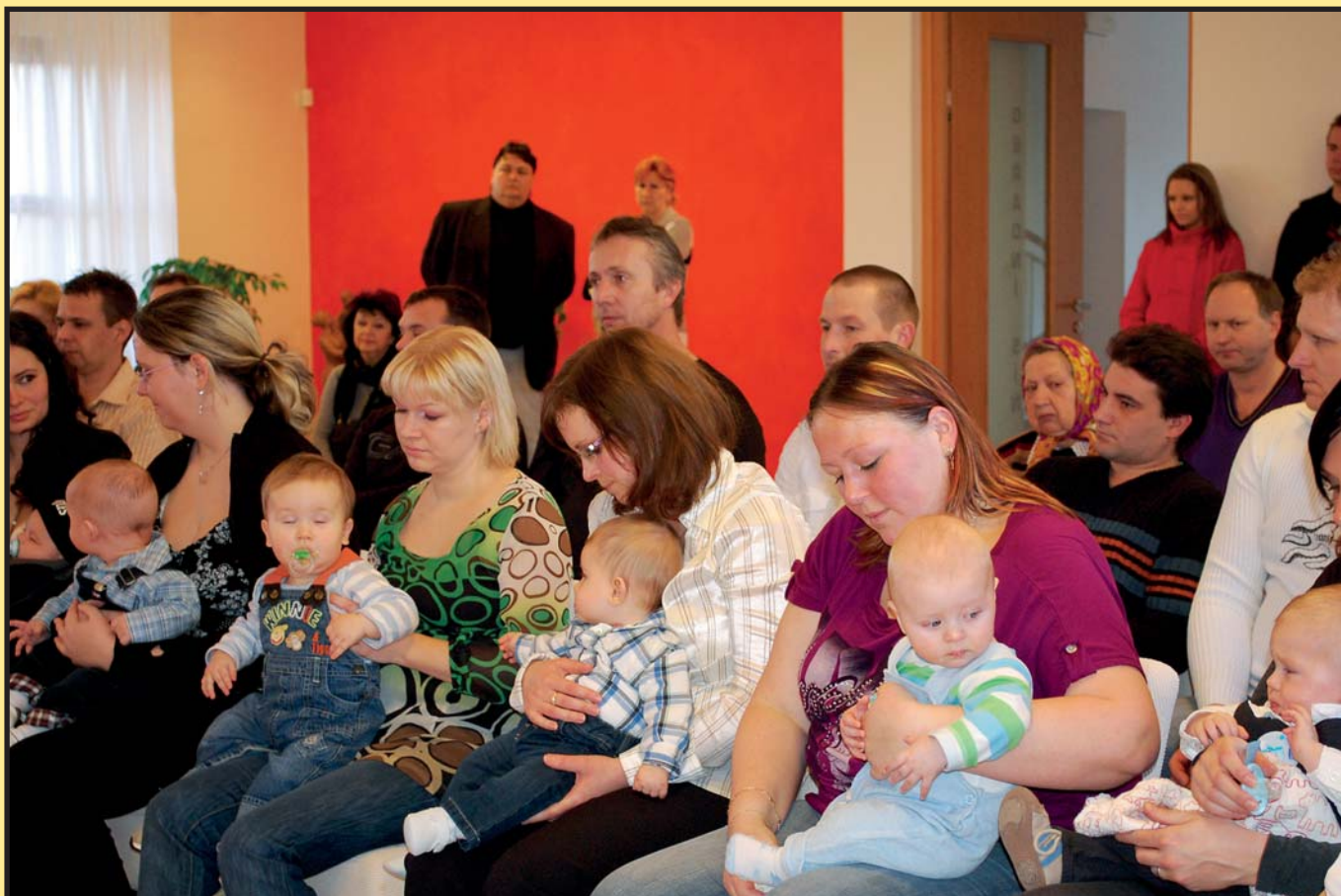
... a vítání občánků v lednu 2011.