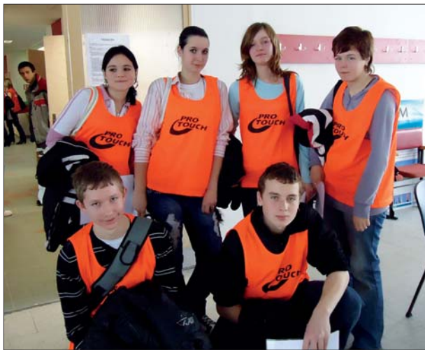
Žáci 9. ročníku ZŠ Otnice v ISS Sokolnice.