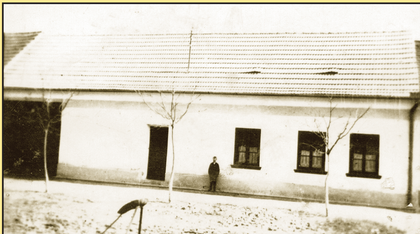
Dům rodiny Hložkovy č.p. 1 kdysi...