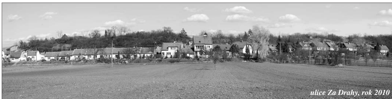
ulice Za Drahy, rok 2010

zemědělských usedlostí. Zde se mlátivalo obilí drobným hospodářům. Za kostelem, kde dnes stojí škola, pole zvaná Zákostelí . Od Markového k parku u sv. Jána zván Rajčurňa – vojsko zde cvičovalo koně a je to moc dávno, jak píše kronika.