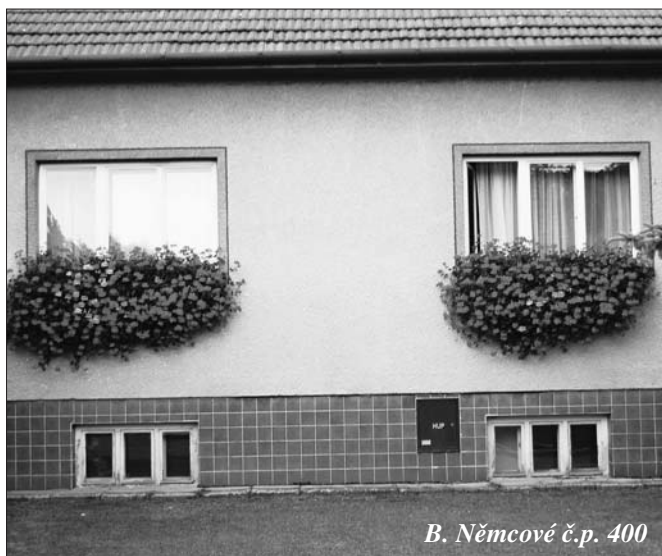
B. Němcové č.p. 400