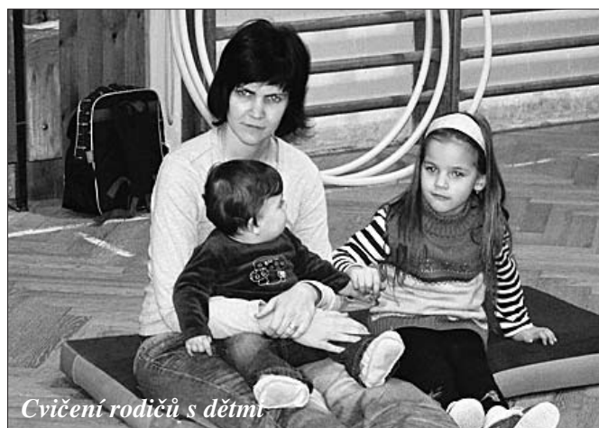
Cvičení rodičů s dětmi