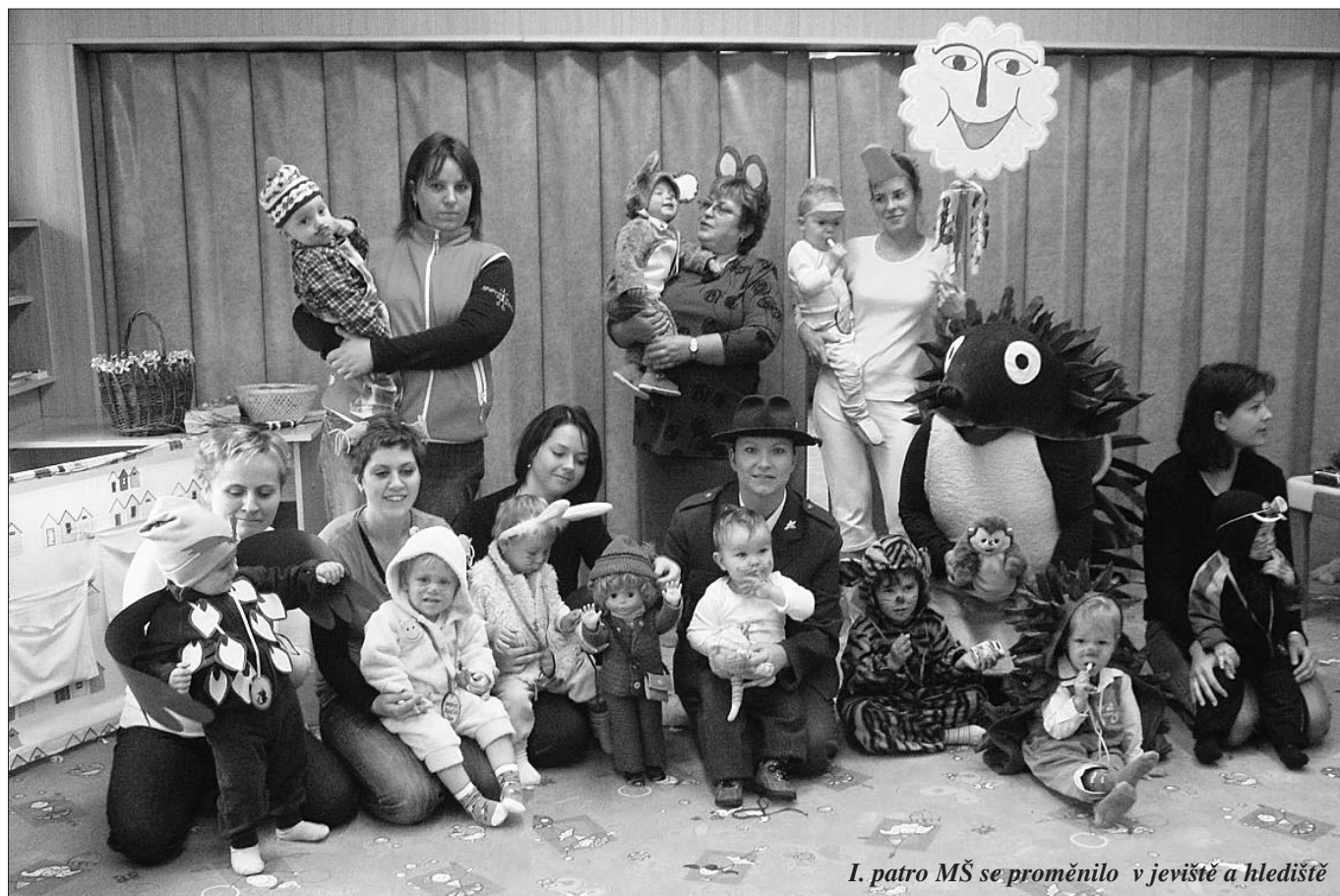
I. patro MŠ se proměnilo v jeviště a hlediště

20. ledna 2010 bude zápis dětí do 1. třídy