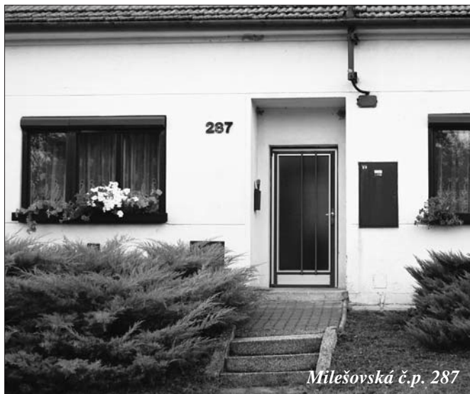
Milešovská č.p. 287

Pro letošní ročník nastala jedna změna, a tou je hodnocení květinových krás v celku, to znamená, nerozlišovali jsme květinová okna a balkóny zvlášť. Vítězové vzešli tři a ani tentokrát jsme nezapomněli na cenu poroty, čili ocenění těm, kteří mívají krásné květinové výzdoby každoročně.