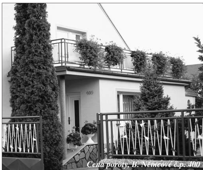
Cena poroty, B. Němcové č.p. 400