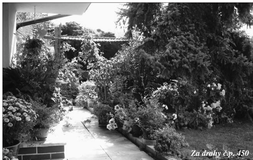
Za drahy č.p. 450

Blahopřejeme všem oceněným. Samozřejmě květinových výzdob bylo mnohem více, ale místa ve zpravodaji je omezeně.