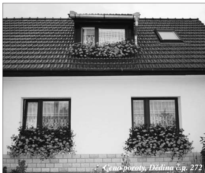
Cena poroty, Dědina č.p. 272