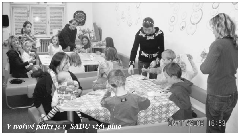
V tvořivé pátky je v SADU vždy plno