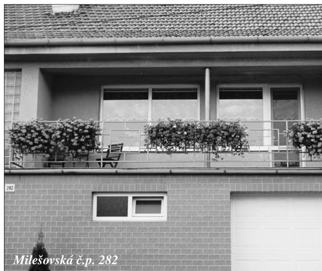
Milešovská č.p. 282