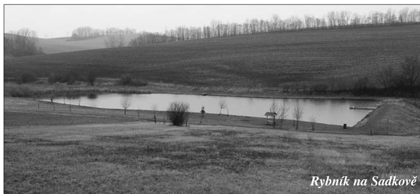
Rybník na Sadkově

Pochvalu si zaslouží ti občané, kteří před svými domy pečují o prostory, byť jsou obecní. Proto vyhazovat vše, co nám doma překáží v tichosti do okolí obce, je zlořád, který je třeba opus-