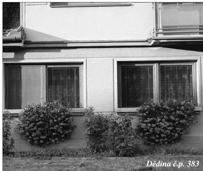
Dědina č.p. 383