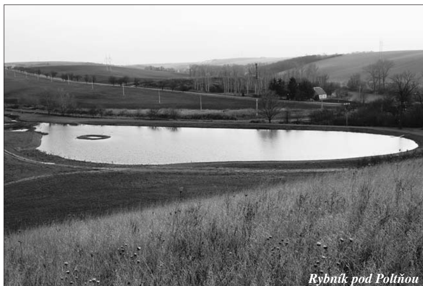
Rybník pod Poltňou