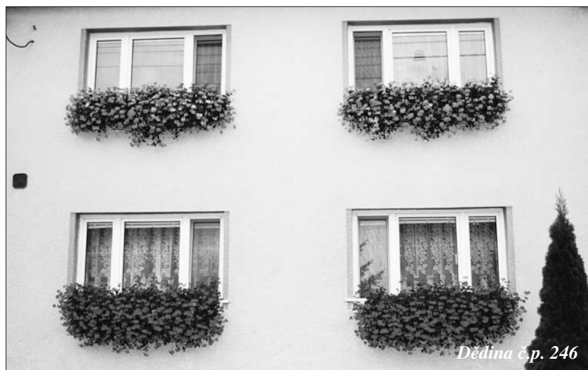
Dědina č.p. 246