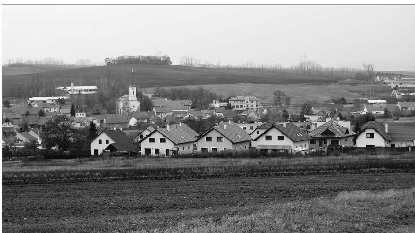
... listopad 2009.