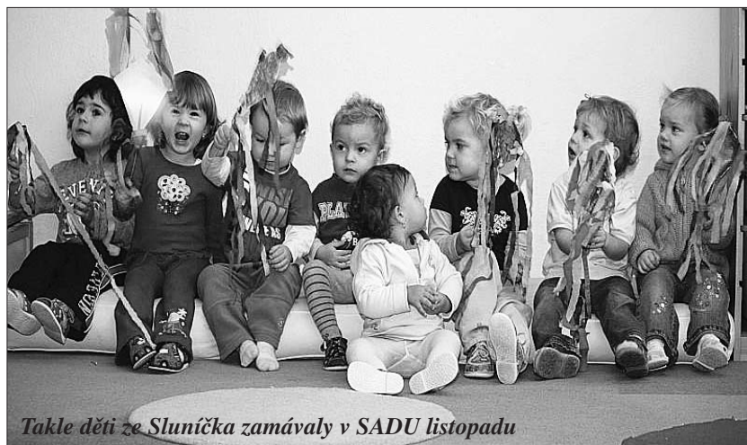
Takle děti ze Sluníčka zamávaly v SADU listopadu

Stále sbíráme prázdné tonery a víčka od PET lahví