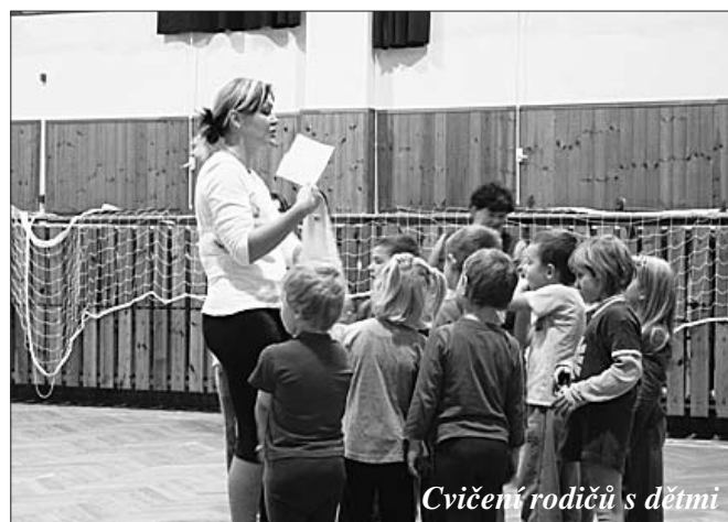
Cvičení rodičů s dětmi