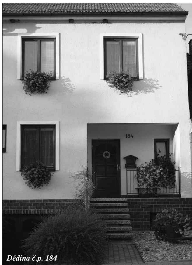
Dědina č.p. 184