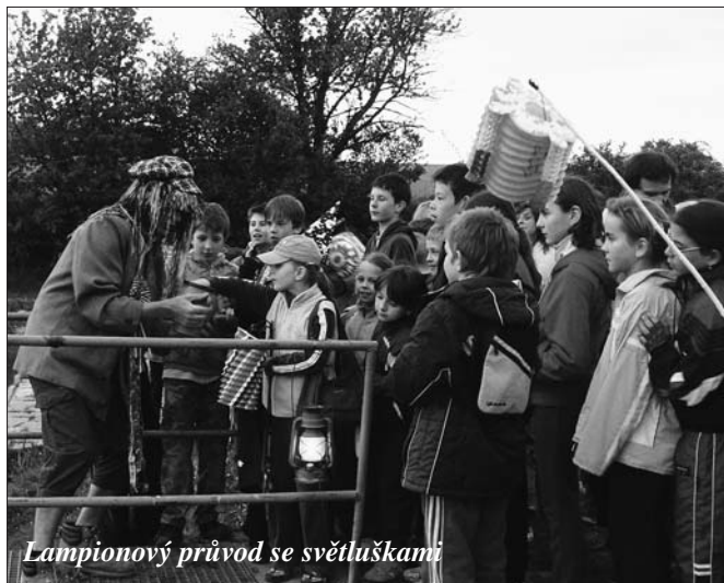
Lampionový průvod se světluškami