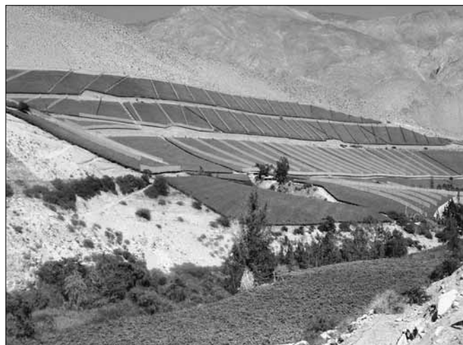
Horské vinice - Cochiguaz

V pátek 16. 2. 2007 nás potřeba výměny peněz přiměla hledat směnárnu. Velkým překvapením pak pro všechny bylo zjištění, že ačkoliv jsme v Combarbale našli několik bank, tak v žádné nám směniti dolary za chilská pesa nechtěli.