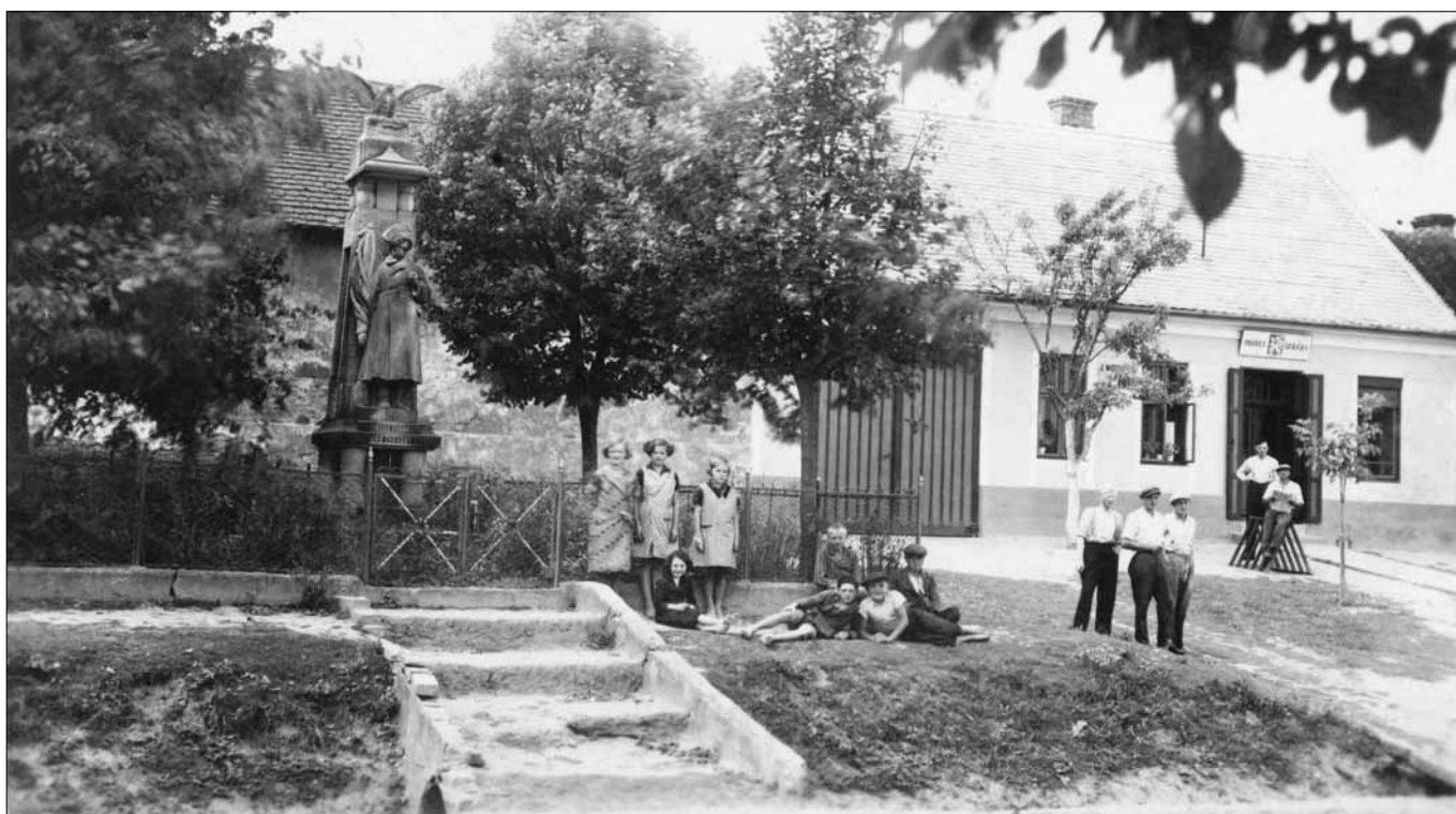
Pohled na památník obětem I. světové války před léty...