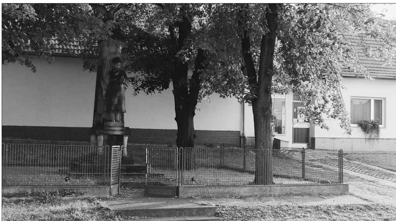
... a dnes.