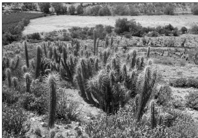
Krajina v okolí Salamanky, department Coquimbo

Po krátkém občerstvení v Salamance jsme nabrali směr Combarbala, cestou jsme minuli národní park Las Chinchillas. Jelikož jsme do Combarbali dorazili již za soumraku, odložili jsme další kaktusové dobrodružství na příští den.