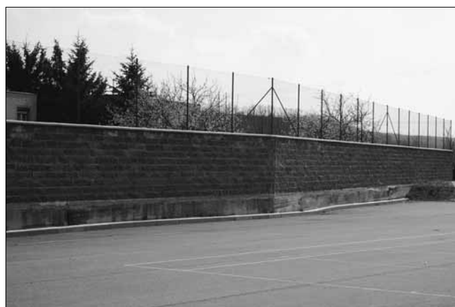
Pohled na šedou betonovou stěnu na hřišti

Jistě se vám do rukou už dostal letáček s výzvou k podání výtvarného návrhu celé stěny. Pokud jste se zapojili, děkujeme vám.