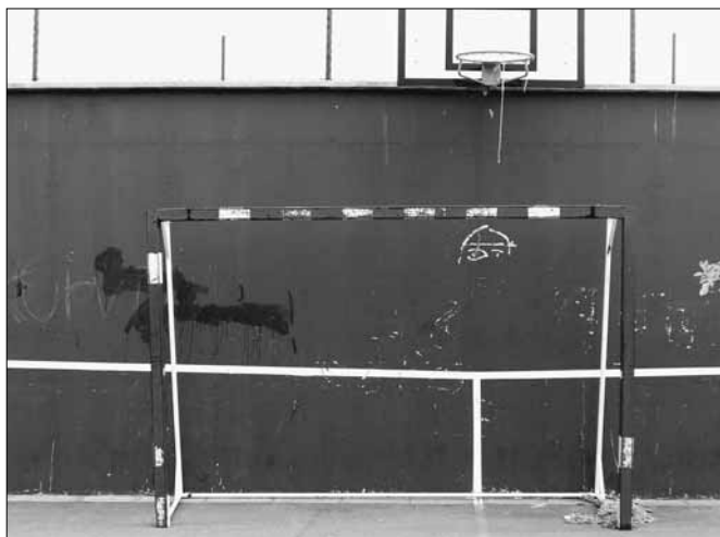
srpen 2007 - zničené sítě v bráně i basketbalové koše