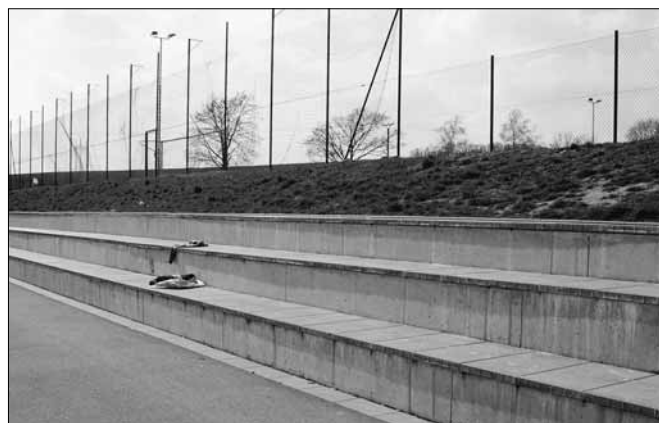
Pohled na schody

zmizí šed' - hned teď! A s velkým očekáváním jej odeslali. Za velký úspěch pokládáme poskytnutí grantu ve výši 30.000 Kč z výše jmenovaného programu.